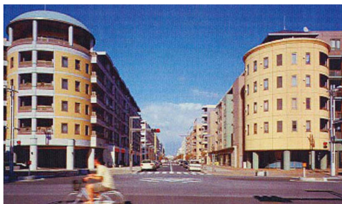
幕張ベイタウンの街並み（16番街と18番街）