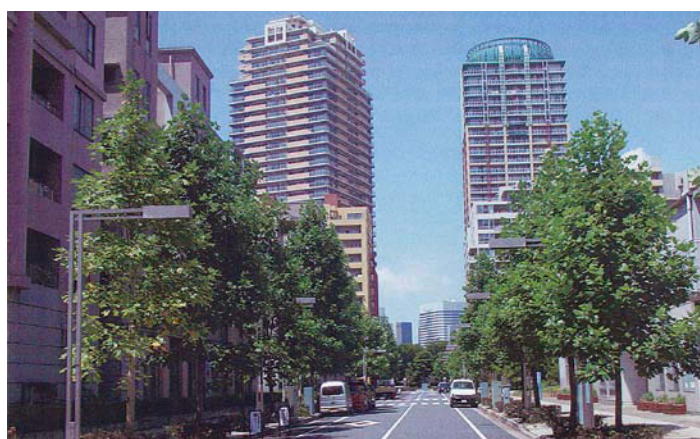
打瀬東通りからの眺め