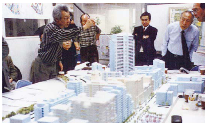
都市デザインワークショップの様子