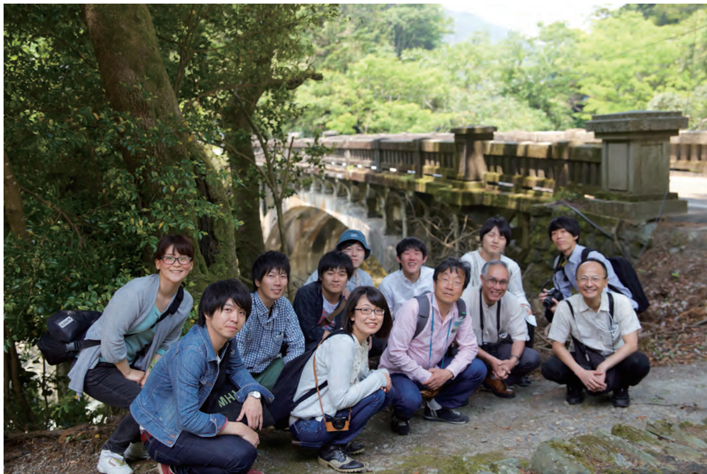
写真 6-1. 事例ツアー参加者。大宮橋にて撮影。

2016年5月22日（日）、東予モデルコースを基本とした事例ツアーを実施した。 会員3名、一般10名、合計13名が参加し、5カ所以上の事例を見学した。