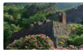
④別子銅山 東平地区