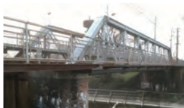
⑥石手川橋梁、煉瓦橋