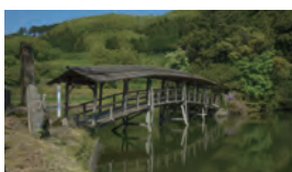
⑥弓削神社の屋根付き橋