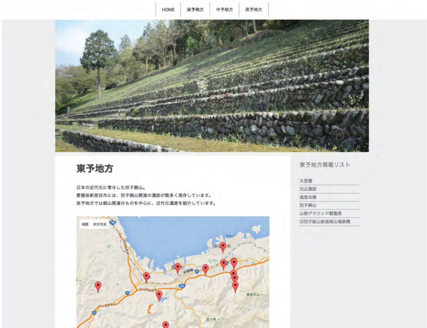
図5. 愛媛都市環境デザインツアー HP