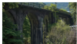
③国鉄 第二女夫岩橋