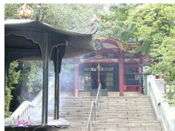
* 浅草寺の子院、待乳山聖天