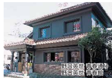
野口英世 青春通り 野口英世 青春館