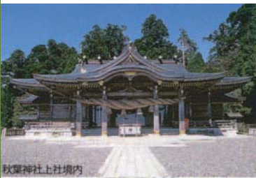
秋葉神社上社境内