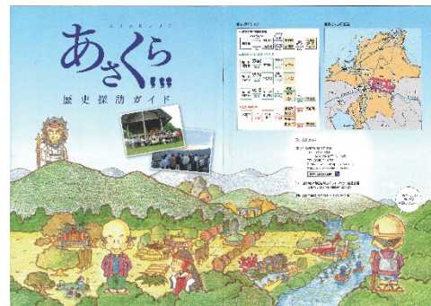
2 あさくら歴史探訪ガイドブック