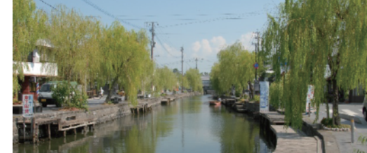
4 矢部川流域景観計画