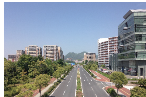
3 アイランドシティ (福岡市東区香椎照葉)