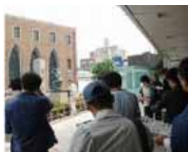
会員、一般、学生など約 30 名が参加

「アートアベニュー」に設置された作品のうち、金沢駅周辺の 13 作品などを見学した。さびが物議を呼んだ「CORPUS MINOR #1」や、歩道に背を向けて設置された「浄」など、置かれた環境も含め、あらかじめ作成された