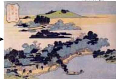
●1832年北斎が描いた琉球八景の久米村